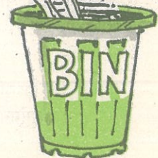
हाडे व मांस