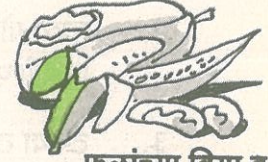
फळांच्या बिया व साली