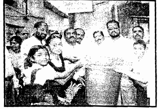
दत्तक वस्तीमध्ये कचराकुंडीचे वाटप