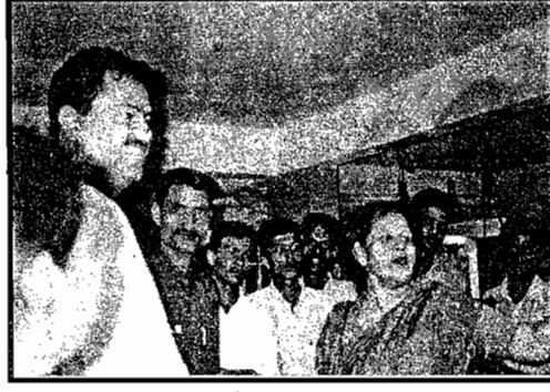
पहेल टिमची जोशी लेन ला भेट