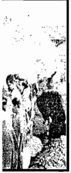
आहणी करताना जित वटी