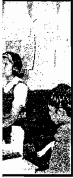
र.डी.ए. , बालभवन ना