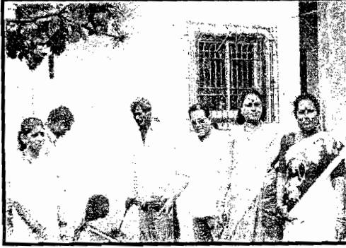
सांडपाणी - निचरा पहाणी करताना वस्ती समन्वयक